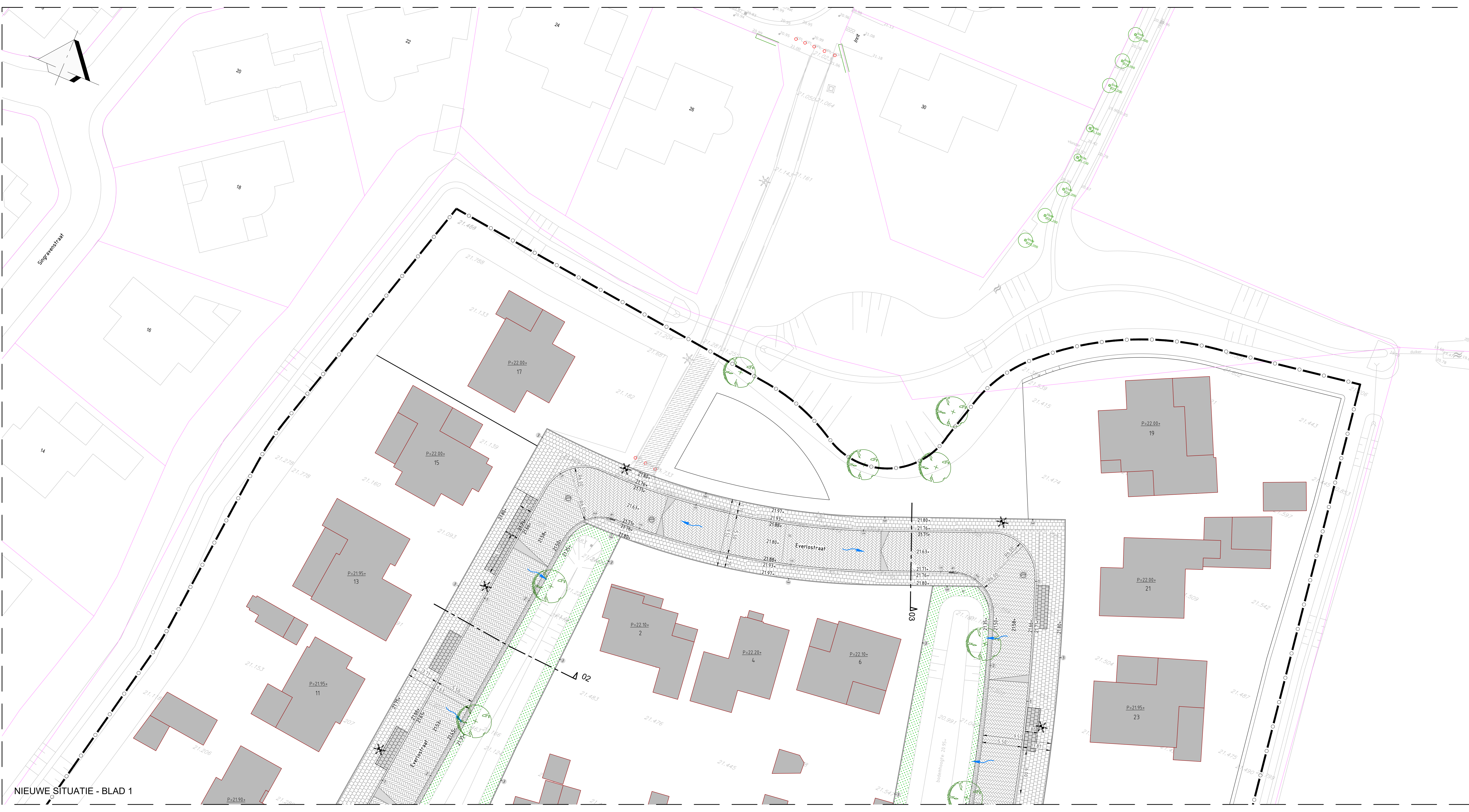
NIEUWE SITUATIE - BLAD 1